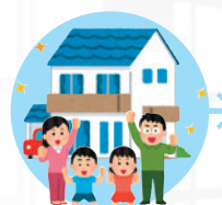
30代 マイホーム購入